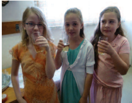
So vielfältig ist das Leben in unserer Pfarre. Vom Pfarrcafé, bei dem auch für die Jüngsten etwas im Angebot ist (Bild oben li.), über den diversen Blumen- und Kerzenschmuck, wie am Bild oben rechts heuer zu Allerseelen...

D as Pfarrcafé am Sonntag nach dem Gottesdienst, die Seniorenrunden, die Kapistranheurigen, die Kochabende, Bastelrunden – das und vieles andere mehr schätzen große und kleine Angehörige unserer Pfarrgemeinde. Denn abseits der Messen und Wortgottesdienste will die Pfarre St. Johannes Kapistran Heimat für alle sein, die sich unserer Kirche zugehörig fühlen. So bemühen sich alle haupt- und ehrenamtlichen Mitarbeiter Festtage wie Weihnachten, Ostern, die Erstkommunion und viele andere Anlässe immer ganz besonders schön zu gestalten. Ein solches lebendiges Pfarrleben bedeutet aber nicht nur einen organisatorischen Aufwand, sondern ist auch mit Kosten verbunden. Aus diesem Grund bittet die Pfarre auch heuer wieder höflich um Ihren Beitrag. Ein Erlagschein ist dieser Pfarrzeitung beigelegt. Schon jetzt ein herzliches Vergelts Gott dafür.