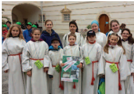
... über die Angebote für unsere Ministranten, wie heuer der Ausflug zum Minitag im Stift Zwettl (Bild oben li.), bis hin zu den Agapenfeier bei großen Anlässen (Bild oben re.).