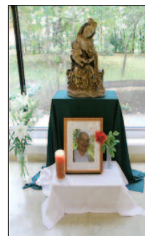
Bild oben li.: Gedenken an Anton Floh, den ersten Pfarrer der Kapistrankirche. Bild oben re.: Segen für die Kinder.