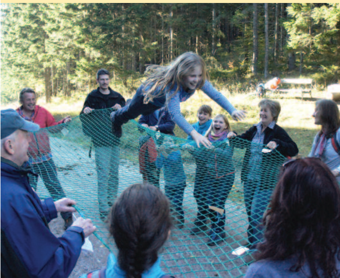
Wallfahrt nach Mariazell: Vom Netz getragen werden macht auch Spaß!

Höhepunkt der vergangenen Monate in der Kapistran Pfarre war natürlich die Eröffnung unserer neuen Kirche und die Segnung des neuen Altars. Auch sonst tat sich vieles in unserer Pfarre: So feiern wir seit September, seit unsere Pfarre mit der Pfarre Spratzern zum Pfarrverband St. Pölten Süd zusammengefügt wurde, jeden zweiten Sonntag im Monat eine Wortgottesfeier mit unseren Wortgottesfeierleitern. Weitere Highlights der letzten Wochen und Monate waren das Erntedankfest und die Tiersegnung am Welttierschutztag.