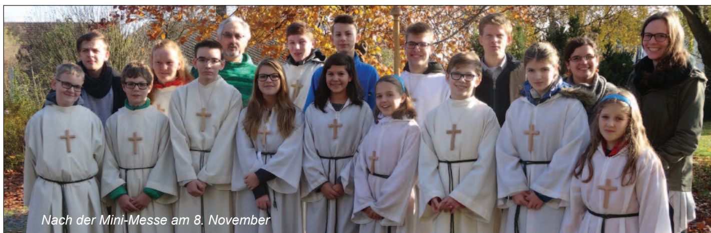
Nach der Mini-Messe am 8. November