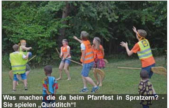
Was machen die da beim Pfarrfest in Spratzern? - Sie spielen „Quidditch“!