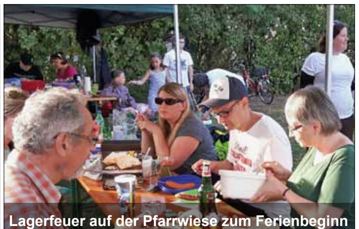
Lagerfeuer auf der Pfarrwiese zum Ferienbeginn