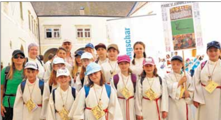
Die Minis aus Kapistran beim Mini-Tag in Lilienfeld und die Minis aus Spratzern beim Ausflug in den Motorikpark Wien