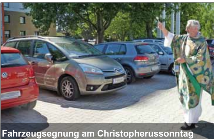
Fahrzeugsegnung am Christopherussonntag