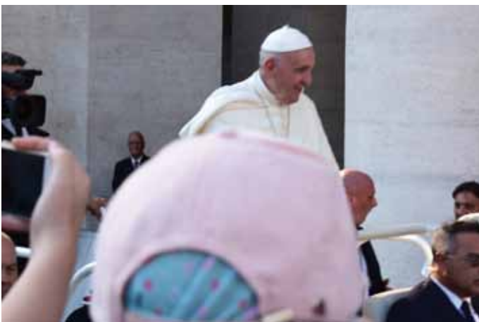
So nah bei Papst Franziskus