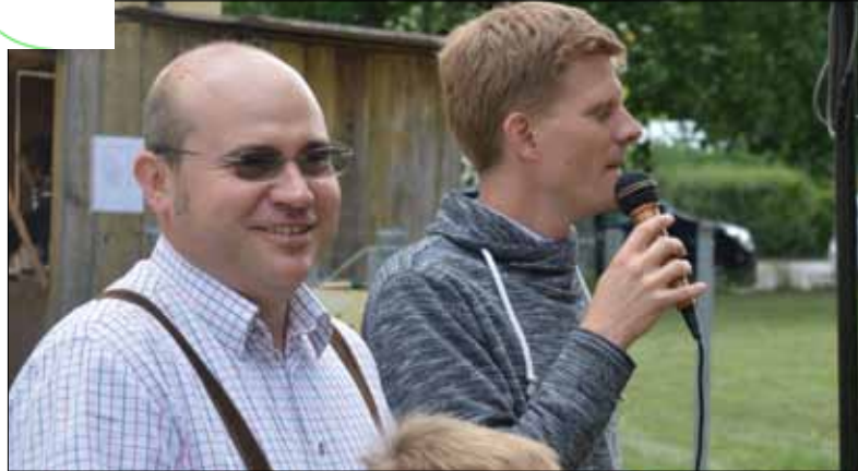
„Herzlich Willkommen beim Pfarrfest“