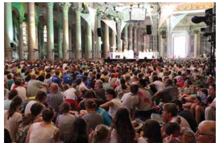
Gemeinsame Messe aller österreichischen Ministranten