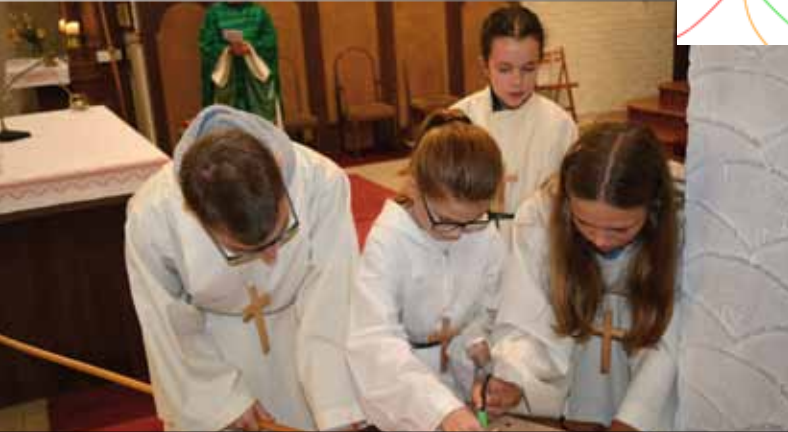
Ministrantenmesse zum Thema „Offener Kreis“