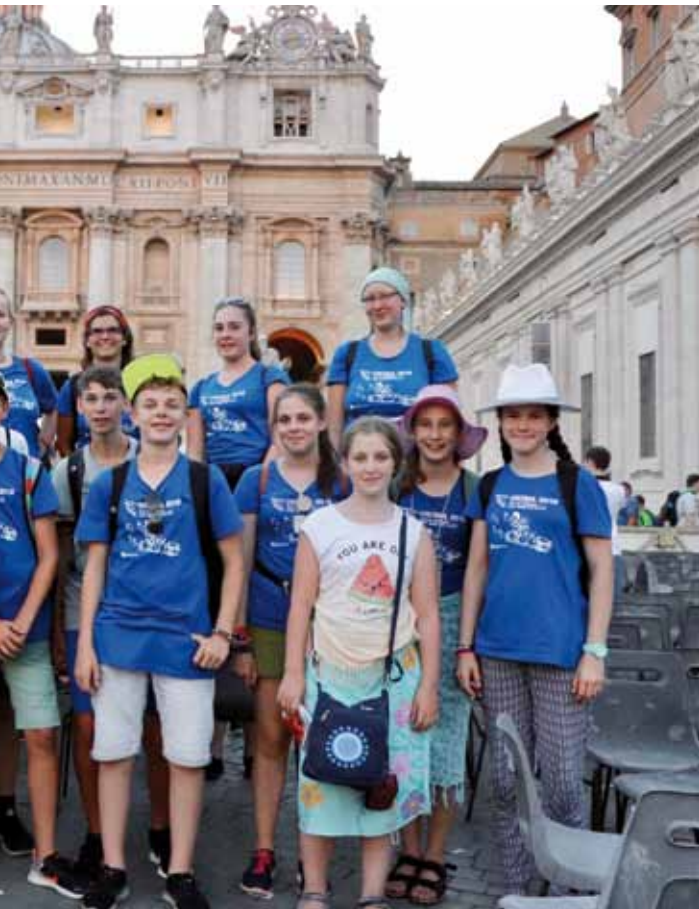
ersdorf und aus der Dompfarre in Rom