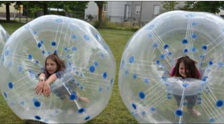
Spiel und Spaß für Groß und Klein ...