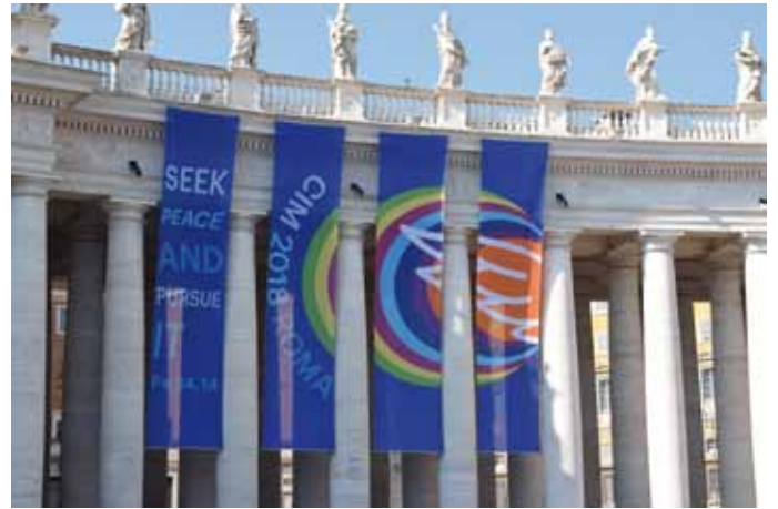
Motto und Logo der Ministrantenwallfahrt 2018