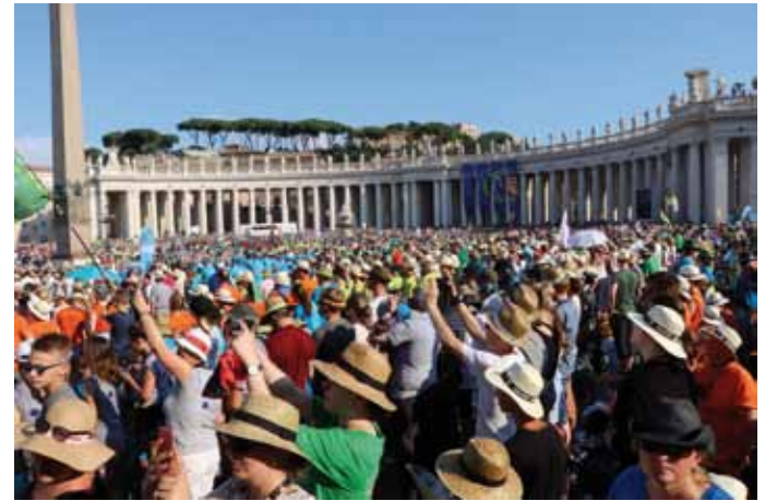
Papstaudienz am Petersplatz