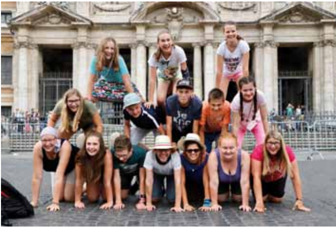
Eine Pyramide in Rom? - Der Spaß kam nicht zu kurz