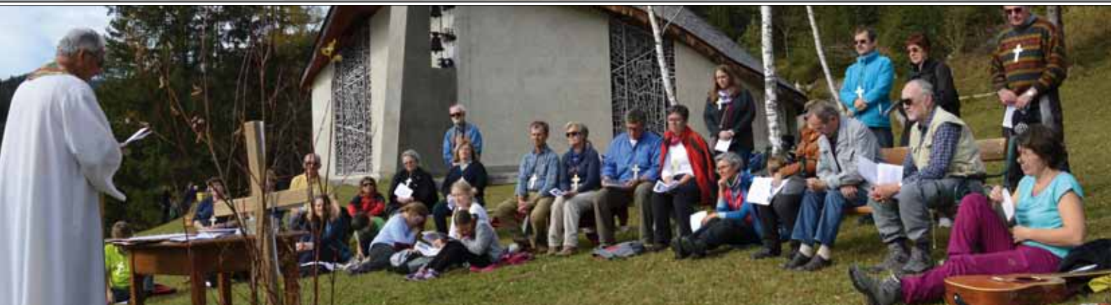
Wallfahrtsmesse unter freiem Himmel