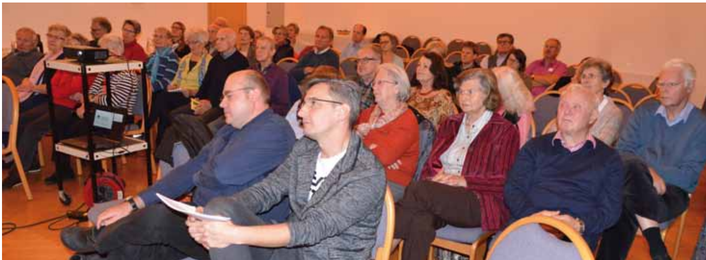
Teilnehmer beim Gemeindeabend am 9. November

Die Pfarrleitung und der Pfarrgemeinderat haben gemeinsam einen Prozess gestartet, der zum Nachdenken über die Zukunft unserer Pfarre anregen will. Wir fragen uns, wie wir auch nach den personellen und strukturellen Veränderungen der letzten Jahre weiter in den Spuren Jesu gehen können.