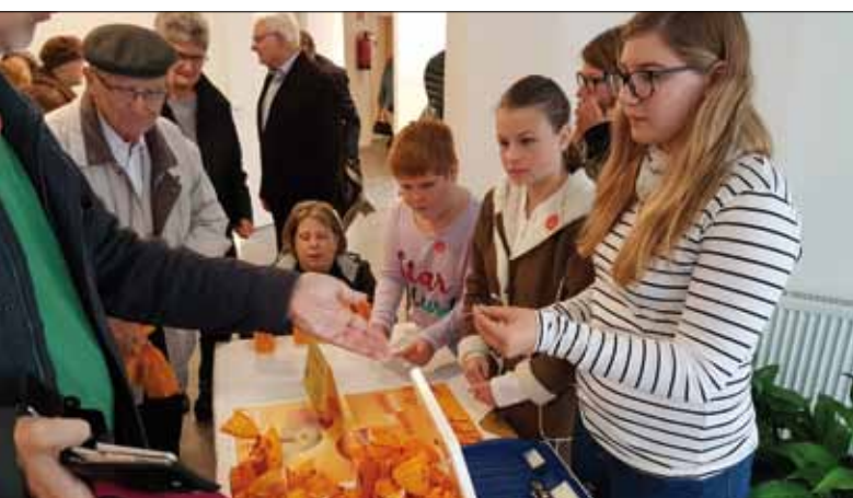
Pralinenverkauf am Sonntag der Weltkirche