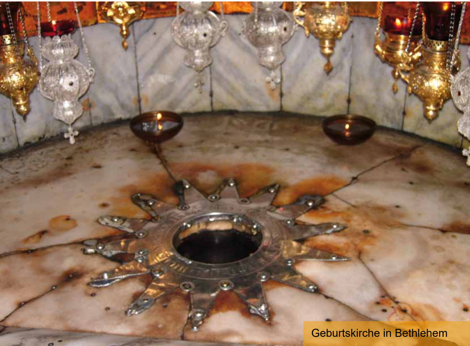
Geburtskirche in Bethlehem

Eine besinnliche Adventzeit und ein gesegnetes Weihnachtsfest wünscht Ihnen das Team des Pfarrblattes