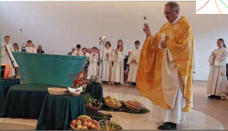
Erntedank in der Pfarre St. Johannes Kapistran