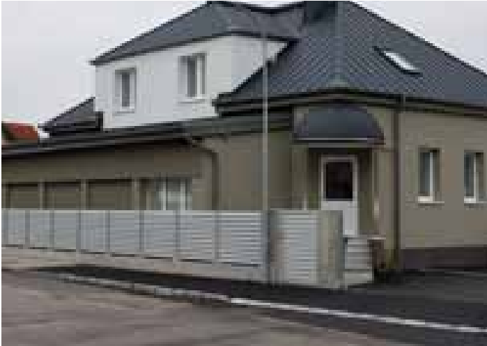
Das neueröffnete Zentrum des bosniakischen Bildungs-, Kultur-, Sport- und Wohltätigkeitsvereins in Spratzern.