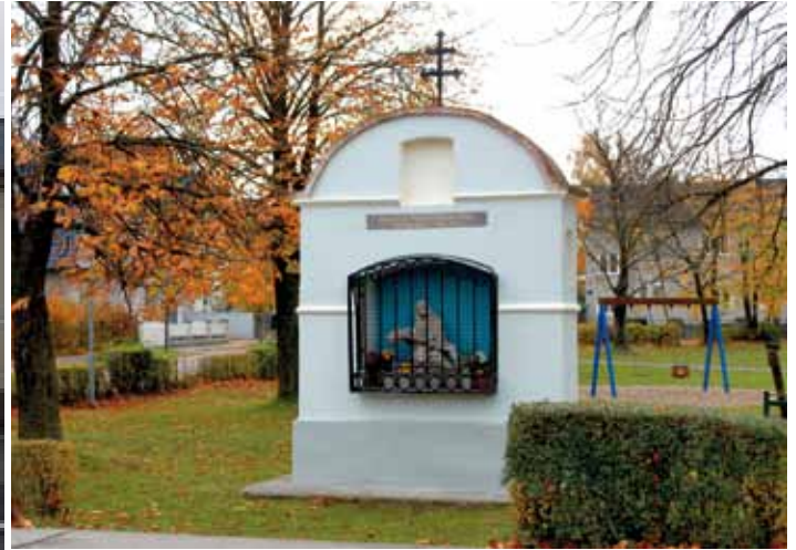
Das Pestmarterl im Hiesberger Park ist eines der ältesten Bau- denkmäler in Spratzern.

Am 13. Oktober 2018 eröffnete der Bildungs-, Kultur-, Sport – und Wohltätigkeitsverein der Bosniaken sein neues Zentrum in Spratzern. Der Verein hat das Haus Nr. 7 in der Aquilin-Hacker-Straße erworben und umgestaltet.