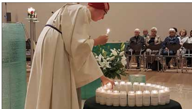
Zu Allerseelen gedenken wir unserer Verstorbenen