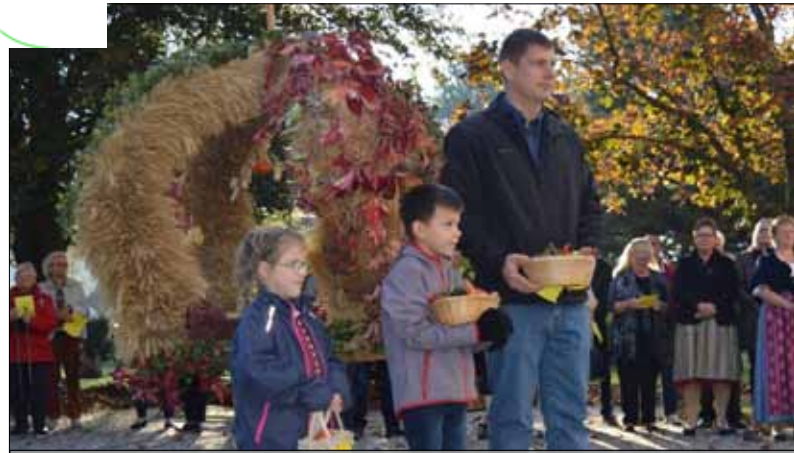
... in der Pfarre Spatzern