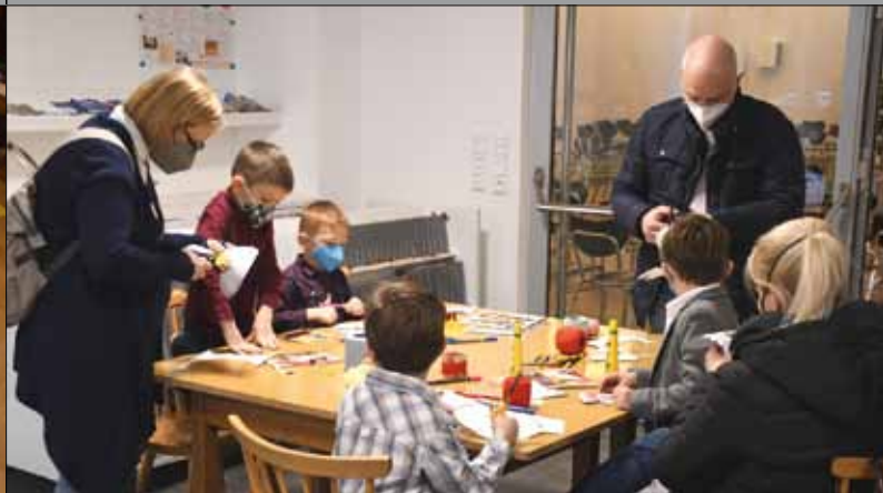
... und in der Pfarre St. Johannes Kapistran