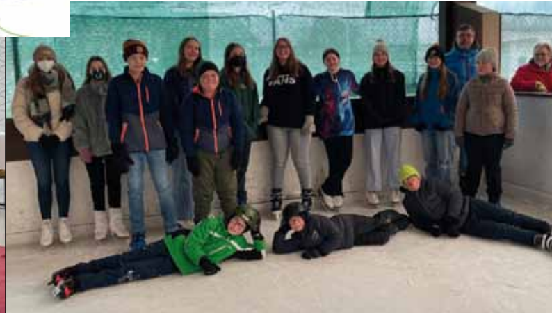
Unsere Minis wagen sich gemeinsam aufs Eis.