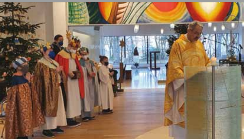
Sternsingermesse in St. Johannes Kapistran