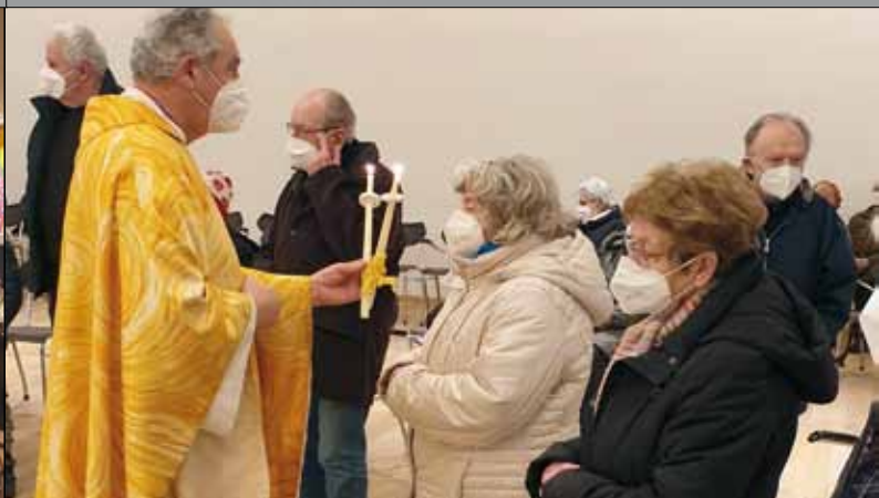
Blasiussegen in St. Johannes Kapistran