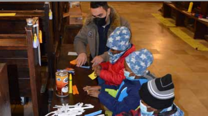
Stimmungsvolle Kinderweihnacht in der Pfarre Spratzern ...