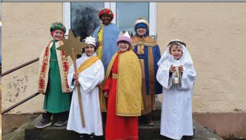
Auch die Spratzerner Könige haben fleißig gesammelt