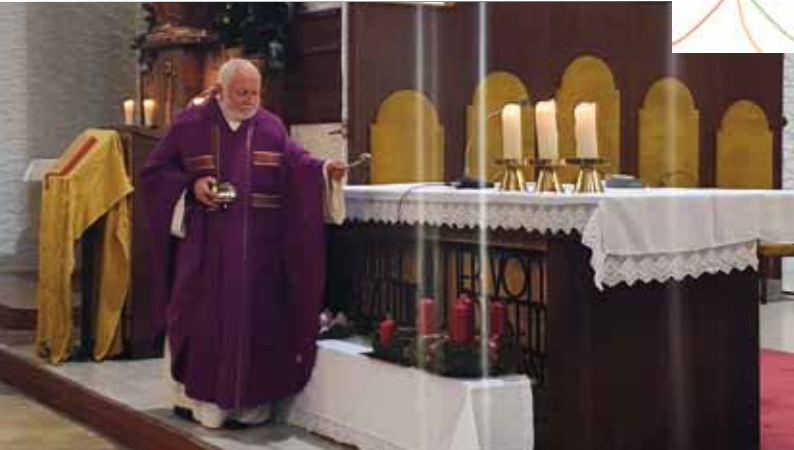
Adventkranzweihe in der Pfarre Spratzern